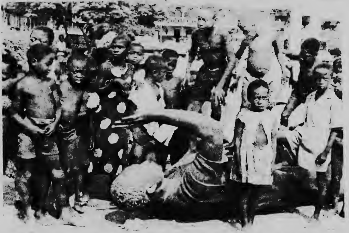
ACCRA--GHANA--Aki nos por mira algun mucha ta hungando riba e estatua di presidente derroca di Ghana Kwame Nkrumah. E estatua tabata den centro di Accra te cu siman pasa prome cu e golpi di estado.

Ankrah a declara cu estado Ghanaes lo debilbe na empresarionan priva algun compania estatal i cu e gobierno lo ocupe solamente cu e proyectonan fundamental pa e nacion. Nan a apoya competencia na beneficio dje economia nacional" Tam